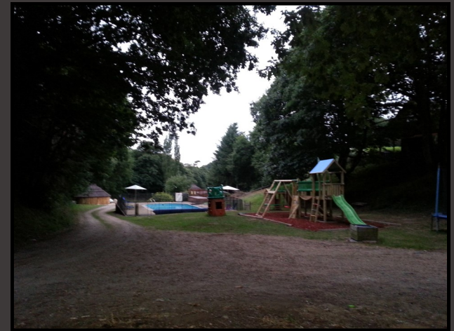
Des structures de détente et de loisirs