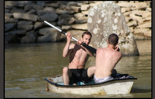
Aire de jeux